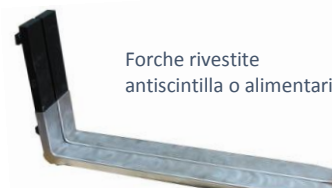
Forche rivestite antiscintilla o alimentari

Tutti i prodotti descritti sono realizzati in Italia e provvisti di certificazione rispetto all'attuale direttiva macchine. Le forche standard delle dimensioni più comuni sono normalmente disponibili a magazzino