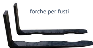
forche per fusti

FORCHE SPECIALI REALIZZABILI A RICHIESTA