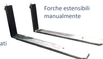
Forche estensibili manualmente

FORCHE SPECIALI REALIZZABILI A RICHIESTA